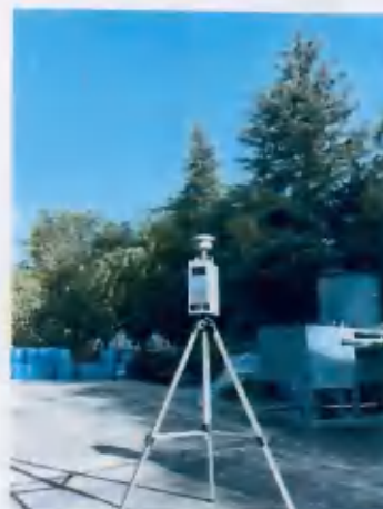
○2 下风向厂界外 5m