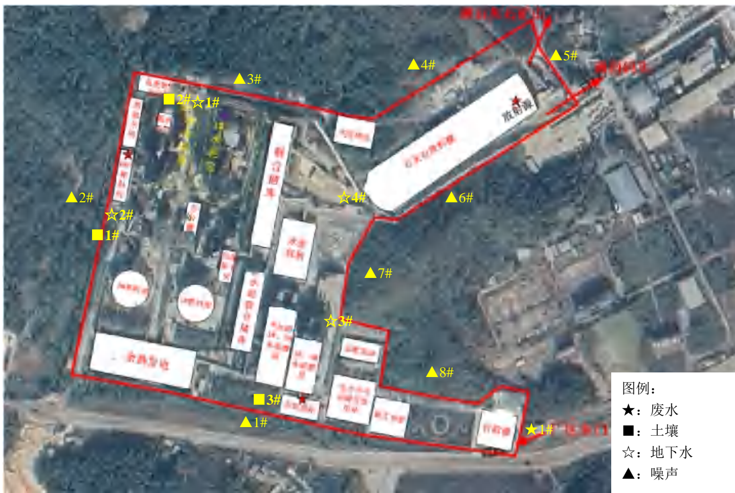
附图 1 监测点位图