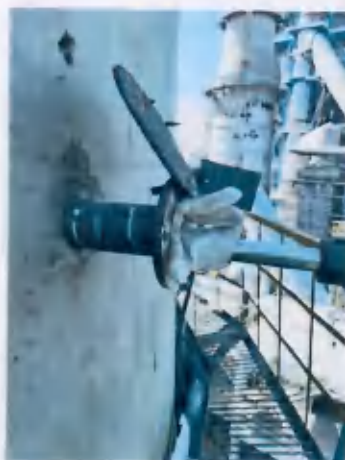
◎2 二号窑尾废气出口