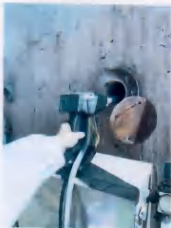
◎1 一号窑尾废气出口