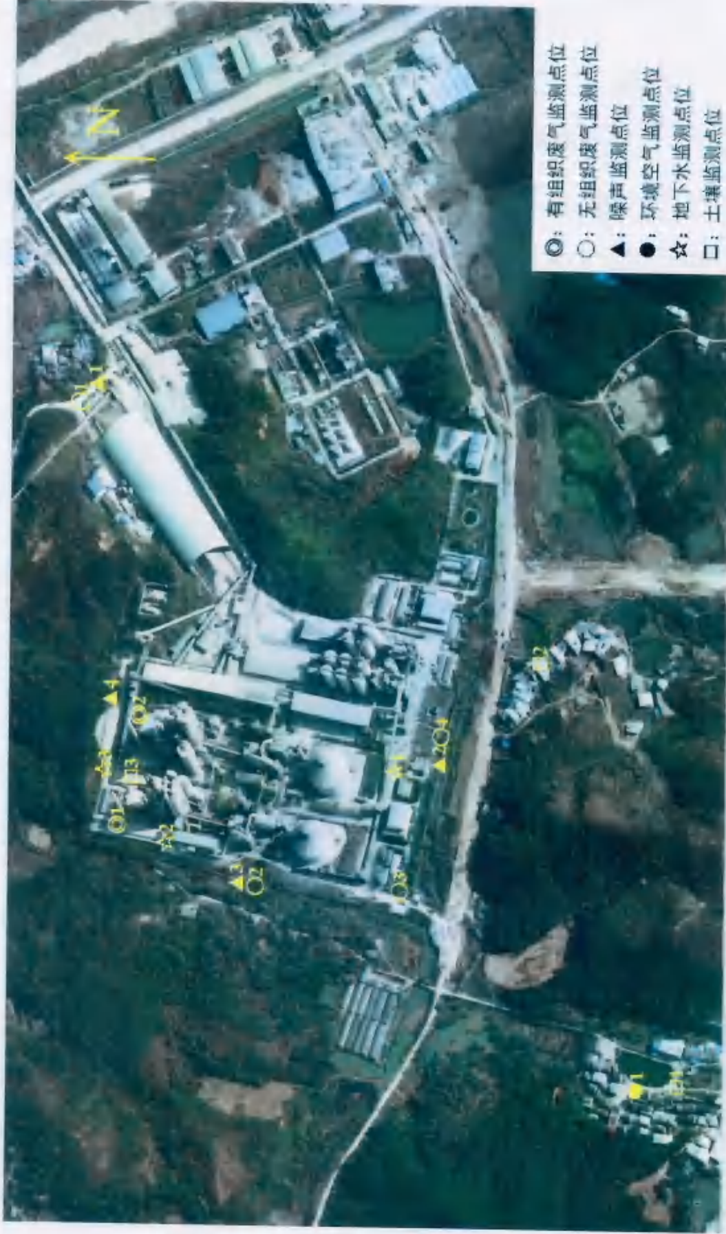
附图 1: 监测点位布设图