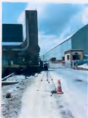
○1 上风向厂界外 20m