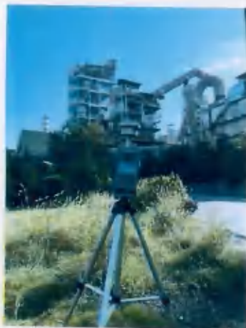
○3 下风向厂界外 5m