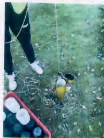
☆1 厂区地下水监测井