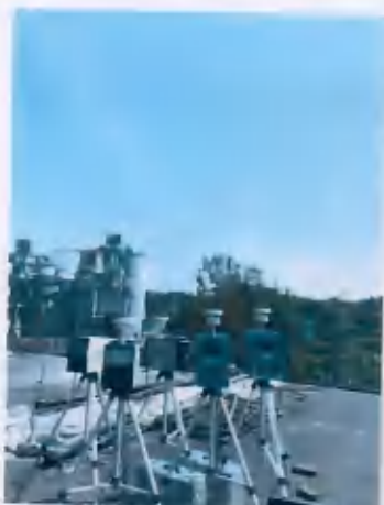
●1 项目西北侧敏感点 (冯坳上)