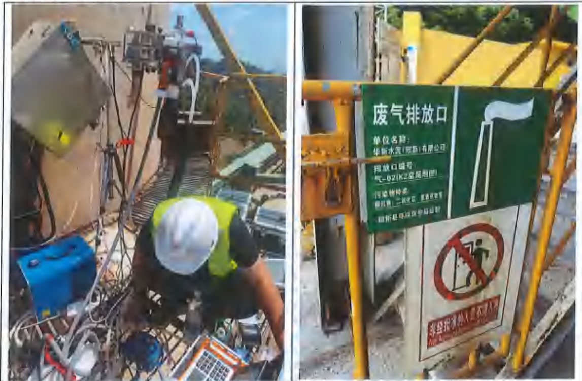
二号窑尾废气排气筒①