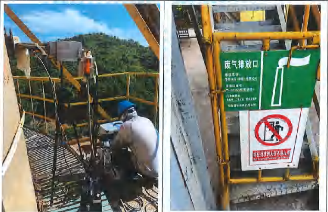
一号窑尾废气排气筒②