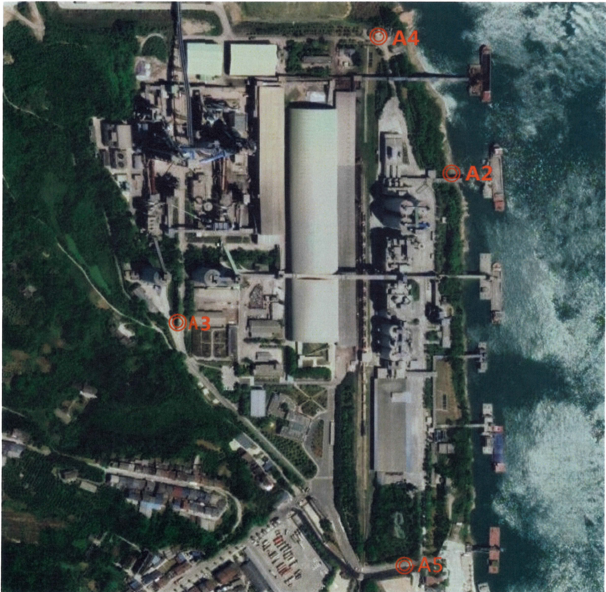
附图 1：无组织废气检测点位示意图